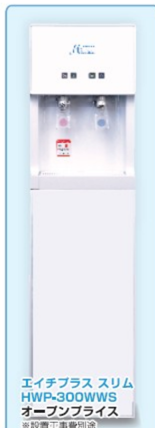
エイチプラス スリム HWP-300WWS オープンブライズ ※設置工事費別途

上記貯水量は、温度・圧力により変化するため、おおよその数字です。性能向上のために予告なく変更することがあります。