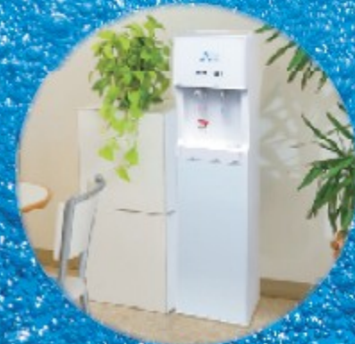
エイチプラス スリム HWP-300WWS